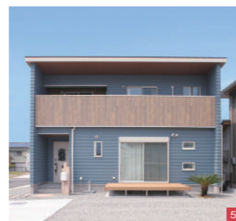
④理想のイメージを伝えて、造作してもらった洗面スペース。壁はタイル調でコーディネート ⑤外壁は、小幅の板を一枚一枚重ねながら張り合わせいくラップ仕上げで味わい深い雰囲気 ⑥日当たりのいい角地に立つS邸。大小さまざまな窓があり、風も心地よく通り抜ける