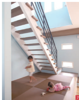
⑧「大勢で集える家にしたい」「ハワイにいる気分を味わいたい」と伝え、デザインされたLDK ⑦オープン階段と畳スペースを一体化させたのは奥さまのアイデア ⑨ゆったりとしたレイアウトのキッチン。パントリーの入り口はアーチ型でオシャレに ⑧アカシアの無垢フローリングと木目調の壁が印象的。室内窓の向こうにはガレージがある