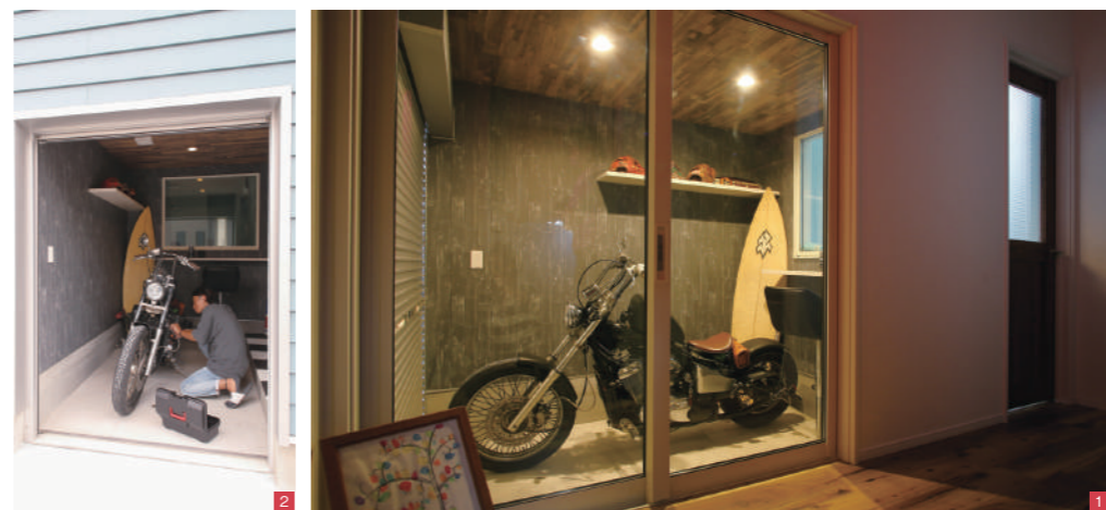
②ご主人の趣味を詰め込んだ、3.3畳のインナーガレージ。棚や窓の位置、木目調の内装など一つひとつこだわってオーダーしたそう