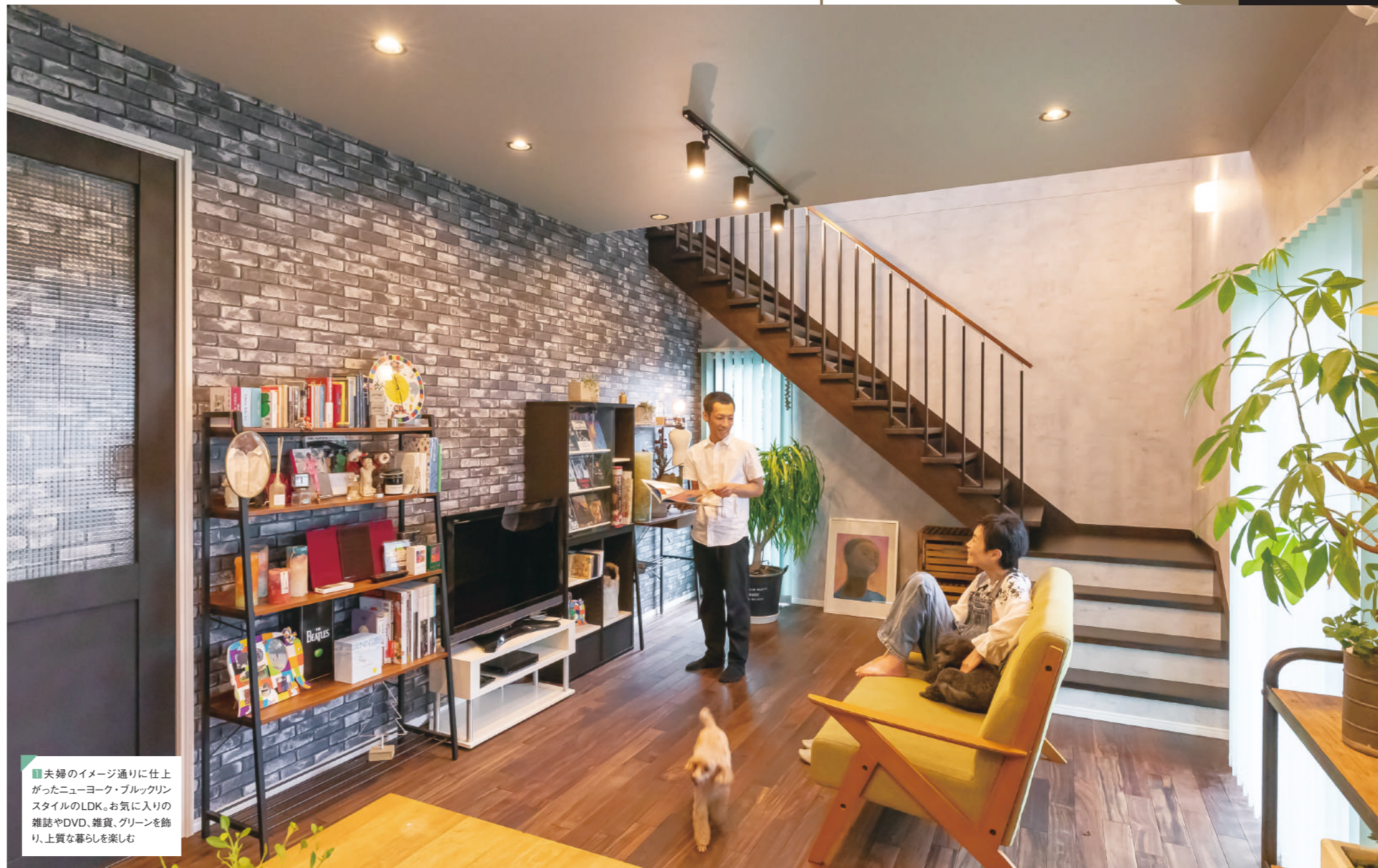
①夫婦のイメージ通りに仕上がったニューヨーク・ブルックリンスタイルのLDK。お気に入りの雑誌やDVD、雑貨、グリーンを飾り、上質な暮らしを楽しむ