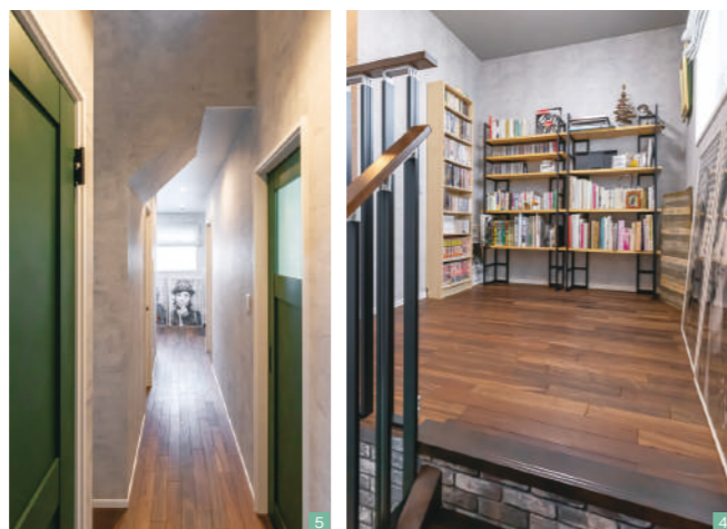
④2階のフリースペース。壁に本棚を造作し、ファミリーライブラリーとして活用している ⑤NYのアパートを彷彿とさせる長い廊下。マットな質感のグリーン色のドアと無機質なクロスがニュアンスを与える