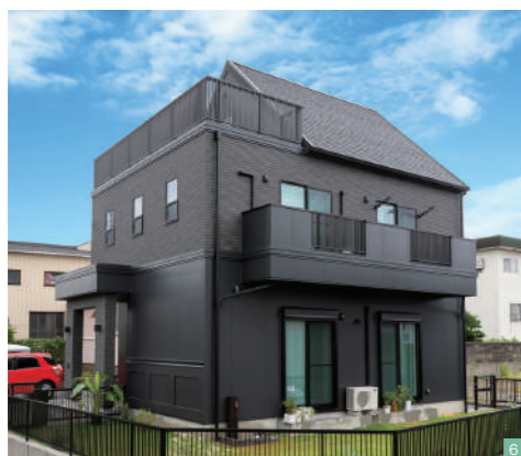
⑥南東から見た外観。総2階+三角屋根のスタイリッシュなプロポーションは、思わず二度見してしまうほどの美しさ。3階のルーバルコニーからは豊橋の街の景色を一望できるほか、外からの視線を気にすることなく、アウトドアリビングとして過ごせる贅沢な空間