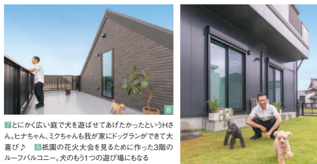
⑦とにかく広い庭で犬を遊ばせてあげたかったというHさん。ヒナちゃん、ミクちゃんも我が家にドッグランができて大喜び♪ ⑧抵園の花火大会を見るために作った3階のルーバルコニー。犬のもう1つの遊び場にもなる

ハウステータ 設計・施工 ▶ 丸昇彦坂建設 構造・工法 ▶ 2×4工法(枠組壁工法) 敷地面積 ▶ 217.26㎡ [65.72坪] 延床面積 ▶ 105.16㎡ [31.82坪] (1階 52.58㎡、2階 52.58㎡) 施工期間 ▶ 5か月 竣工 ▶ 2019年7月