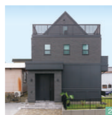
②住宅街でひときわ目を惹く独創的な外観フォルム。ブラックの壁に緑の芝生が映える

家を建てたいはずと思っていました。住んでいたアパート周辺の環境が好きだったので、近所で土地を探していたら、散歩中に理想的な土地を見つけたので。