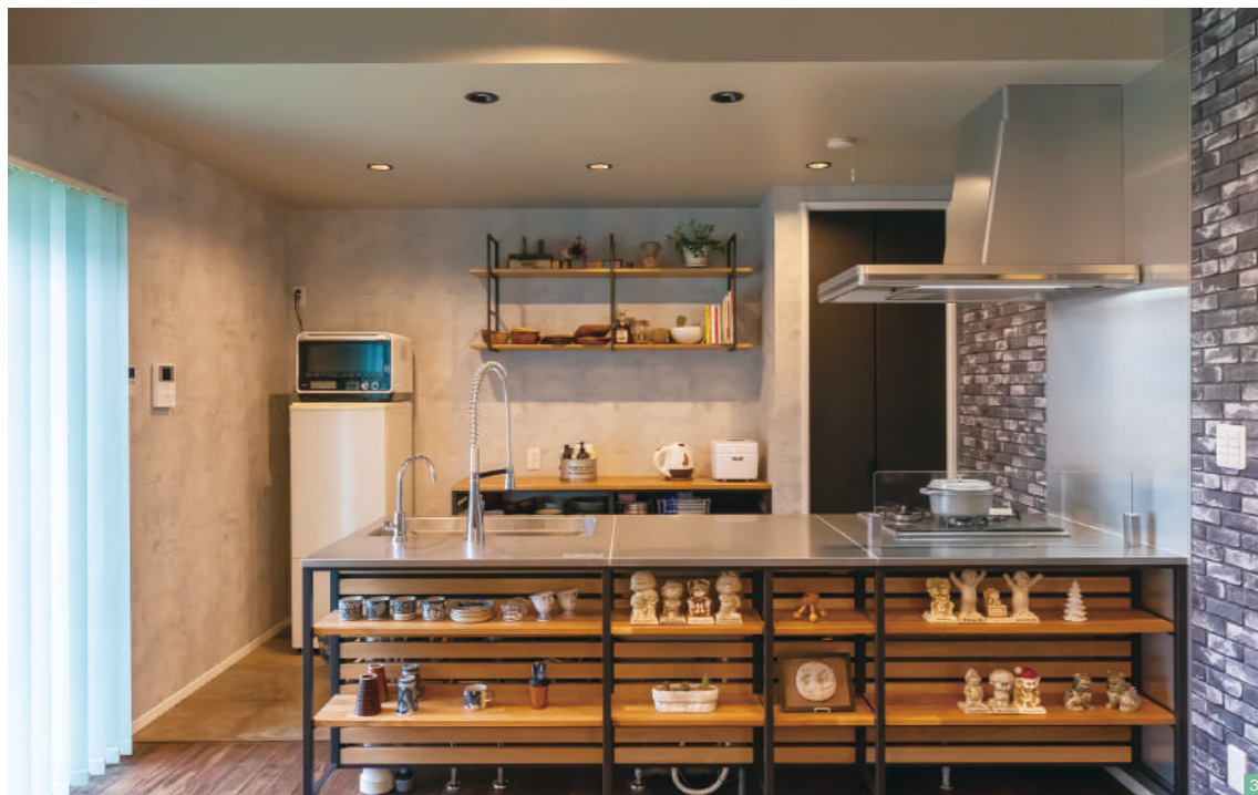
③スタイリッシュなフレームキッチン。アイアン、ステンレス、木、レンガ調のクロスが調和し、ちょっぴり男前な雰囲気。見える収納棚にかわいいメッセージドールが並ぶ