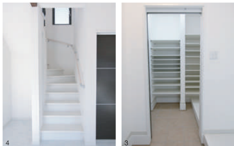
3. 玄関横には大容量収納できるクロークが、靴を履いたまま移動ができるのでとても便利だそう 4. 家族がどこに居るかが分かるようにとりビングイン階段を設置。左側にはパソコンデスクを置く為のスペースに

です。家を建てたあとのアフターサービスも良く、ここで家を建てて良かったと思えます」と嬉しそうに話してくれました。担当者の提案で、2階の窓枠にはアイアンを使った花壇スペースや、現場監督からは外観の角にレンガを設けたたかみのある住まいに。家族の理想をカタチにしたアイデア満載の家づくりに大満足しているそう。