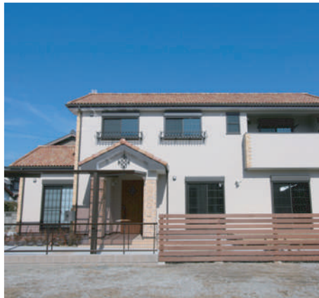
鮮やかな洋瓦や優しい色合いのプロヴァンススタイルの外観。友人からも大好評だそう