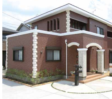
レンガ調の外観が目を引くKさん宅。アイアンをアクセントにした扉もおしゃれ